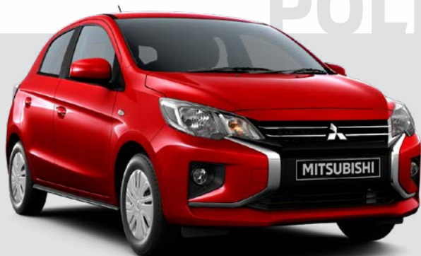
1.2 Invite CVT