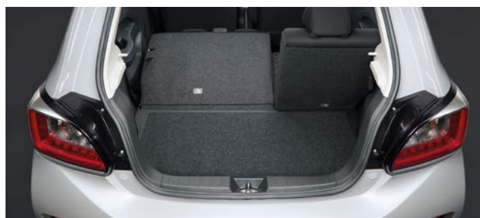
Oparcie tylnej kanapy składane w proporcjach 60:40