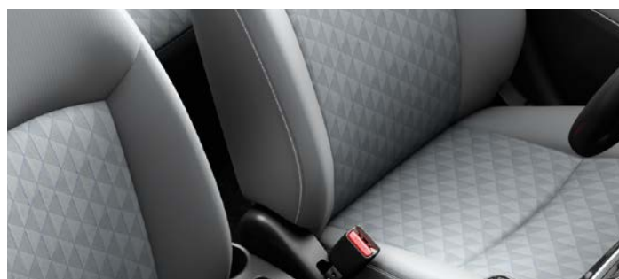
Jasnoszara tapicerka tekstylna