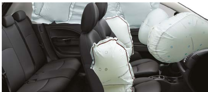
6 poduszek powietrznych w standardzie