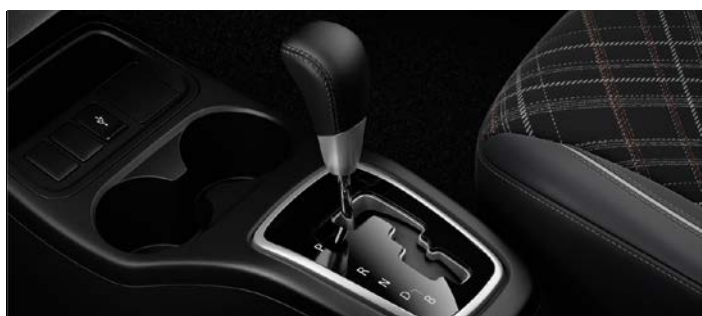
Automatyczna skrzynia biegów